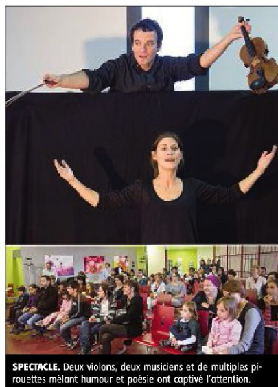
SPECTACLE. Deux violons, deux musiciens et de multiples pirottes mêlant humour et poésie ont captivé l'attention.

Le partenariat « Violon à l'hôpital » s'articule autour de trois temps complé-